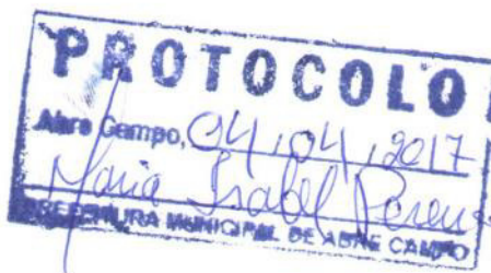
Márcio Moreira Vítor Prefeito Municipal